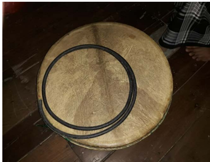
Gambar 2: Alat Musik Burdah